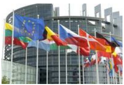
Einen Einblick in die konkrete Arbeit des Europaparlaments bekamen die Schüler der Louise-Schröder-Schule beim Aktionstag des Vereins "Bürger Europas".

WIESBADEN. Das Zusammenwachsen Europas stellt neue Anforderungen an die Ausbildung junger Leute. Der Verein "Bürger Europas" war in der Louise-Schröder-Schule zu Gast, um vor der Europawahl den Schülern die Anforderungen des europäischen Arbeitsmarktes aufzuzeigen.